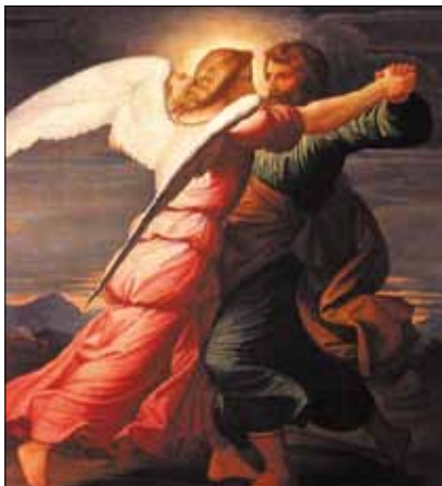
Jacó em Luta com o Anjo (E.V. Steinte)

Aí está a sabedoria que vem do alto, ou seja, saber discernir as coisas que podem e devem ser mudadas e ao mesmo tempo