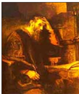
O Apóstolo Paulo (1657), Rembrandt.