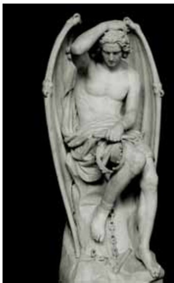
Estátua de Lúcifer em mármore branco, por Guillaume Geefs (Catedral de St. Paul de Liège, Bélgica)

: No Jardim do Éden e caminhava no brilho das pedras preciosas do monte Santo de Deus. [Ez 28:13]