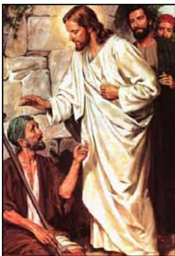
Jesus cura o leproso

Quando Jesus vem, Ele dá uma reviravolta nesses entendimentos. Ele se deixa tocar por uma mulher hemorrágica, toca em defuntos, pega em leprosos. Ao invés de ser contaminado, a sua presença santifica e descontamina. Em Jesus, sagrado já não é mais só o espaço físico do templo, nem só o altar, mas todo o lugar onde está presente um filho de Deus. Em Cristo, já não há mais necessidade de se ungir os utensílios do templo, nem os instrumentos musicais, pois não é o “objeto” que precisa ser separado, mas quem o usa. E todos os que verdadeiramente possuem o Espírito Santo o são: “vós tendes a unção” (1Jo 2.20).