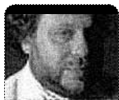
Pr. Caio Fábio

É insuportável ver seres humanos sendo jogados fora do lugar de culto por causa de comida, bebida, cigarro, roupa, sexualidade, ou catástrofes de existência. Isto enquanto se alimenta o povo com maldade, inveja, mentira, politicagem, facções, e maldições. Insuportável é coar o mosquito e engolir o camelo!