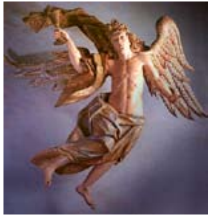
Anjo do Getsêmani (Aleijadinho)