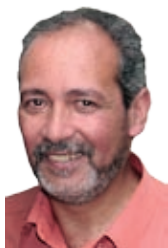
Pr. Daniel - Metanóia pra ti!

Hoje, todos se consideram “filhos da fé”, cada um orgulhoso por pertencer ao seu grupo cristão: um se chama evangélico da gema, outro pentecostal que “passou pelas águas”, aqueloutro a família é de tradição romana e ainda outro pertence ao movimento carismático... Tudo muito lindo, mas se não experimentou a conversão para si com todas as conseqüências, se não se arrependeu verdadeiramente de seus erros e não colocou seu ser cansado debaixo das asas do Altíssimo, que continue em sua “vidinha” religiosa, aparentemente tudo muito certinho, bonitinho, cheirosinho... mas uma coisa ainda te falta: