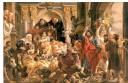
Jesus expulsando vendilhões do templo (Jacob Jordaens. 1650)

Tem camisa com nome bem escrito Tem bonezinho pintado e estiloso Tem disco com cantor ruim, fanhoso E trancelim com pingente esquisito Vendem pulseira com o nome Cristo Também o bom óleo da unção E os lobos enricando de montão Té parece que fazem por pirraça No comércio da fé Jesus não passa De um produto vendido à prestação