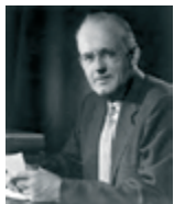
A. W. Tozer

Se o diabo não puder destruir a consciência, seus esforços se concentram na tentativa de enfermá-la. Conheço crentes que vivem em um estado de angústia permanente, temendo que venham a desagradar a Deus. Seu mundo de atos permitidos se torna mais e mais estreito até que finalmente temem atirar-se nas atividades comuns da vida. E ainda acreditam que essa auto-tortura é uma prova de piedade. O cristianismo, estando de pleno acordo com todos os fatos da existência, leva em consideração este desequilíbrio moral da vida humana, e o medicamento que oferece não é uma nova filosofia, e sim uma nova vida. O ideal aspirado pelo crente não consiste em andar pelo caminho perfeito, mas em ser conformado à imagem de Cristo.