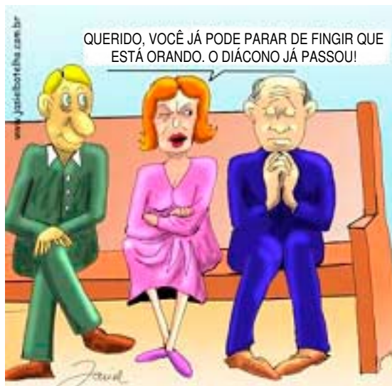
No momento da Oferta...