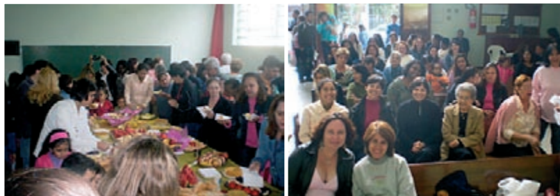
A “disputa” para se servir

Foi simplesmente maravilhoso o Café da Manhã que os homens de nossa igreja prepararam para as Mães. O nosso salão ficou pequeno para as cerca de 70 mães que aqui estiveram (e já estamos pensando em fazer o café na quadra no ano que vem). Além das tradicionais guloseimas deliciosas, queremos dar um destaque para a deliciosa tapioca feita na hora! Quem não veio perdeu!!!