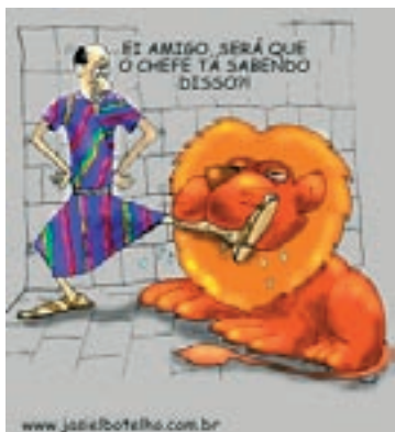
DANIEL NA COVA DOS LEÕES