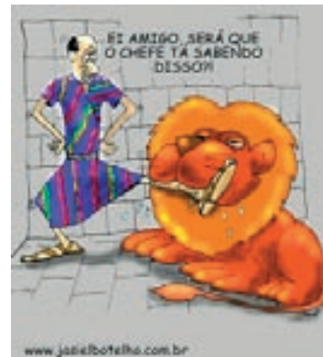
DANIEL NA COVA DOS LEÕES