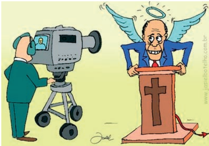
As aparências enganam...