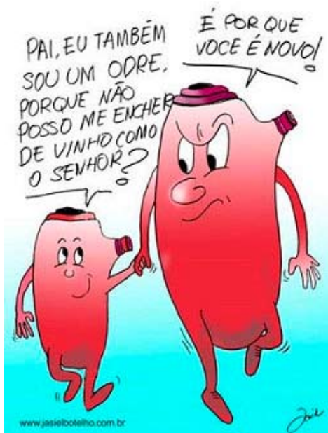
ODRES VELHOS E ODRES NOVOS