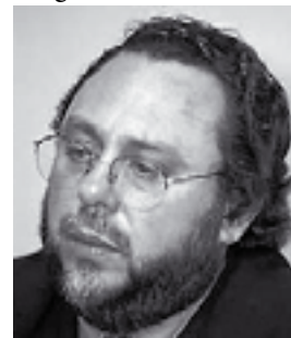
Pr. Caio Fábio

O que as pessoas precisam saber é que se elas crêem em Jesus, então, devem assumir que o mundo vai acabar; a natureza vai gemer até parir algo novo; as nações irão se odiar; os povos se ajuntarão apenas para a guerra; e a grande maioria amará muito mais a mentira que a verdade.