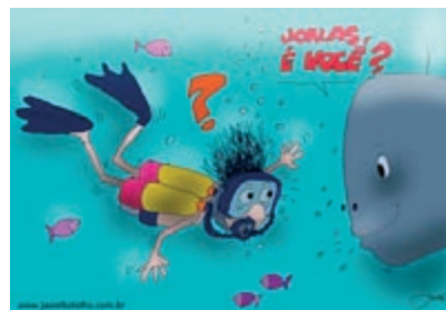
QUEM FOGUE DE DEUS... DÁ NISSO!