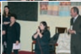
2) ANIVERSÁRIO CORAL (30/09)