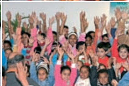
ANIVERSÁRIO CONGREGAÇÃO SANTANA PARNAÍBA (29/09)